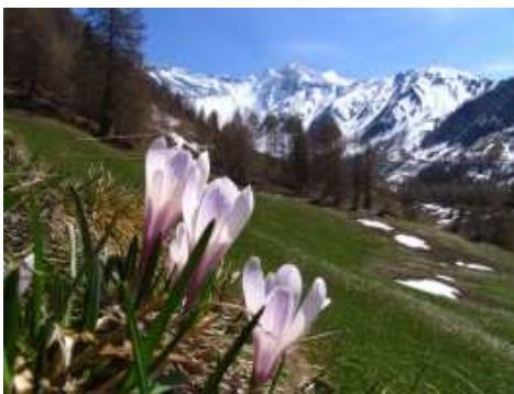
La Valle Aurina

La Valle Aurina (Ahrntal) è situata a 1.054 metri di altitudine ed è uno dei paesi più a nord d'Italia. Ci sono più di ottanta cime sopra i tremila metri.