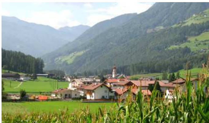
Veduta di San Giovanni in Valle Aurina

La Valle Aurina (Ahrntal) è situata a 1.054 metri di altitudine ed è uno dei paesi più a nord d'Italia. Ci sono più di ottanta cime sopra i tremila metri.